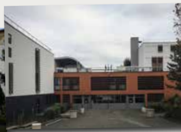
Lycée de Beauregard, Montbrison