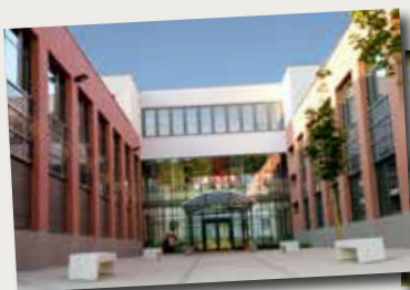
Lycée Adrien Testud, Le Chambon Feugerolles

Une présence sur tout le département grâce à 37 établissements adhérents.