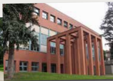
Lycée Jacob Holtzer, Firminy