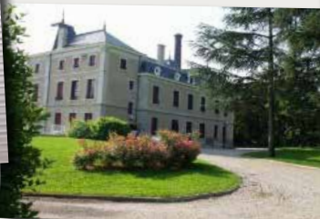
Lycée Hôtelier Les petites Bruyères, Saint Chamond