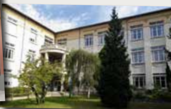
Lycée Albert Thomas, Roanne